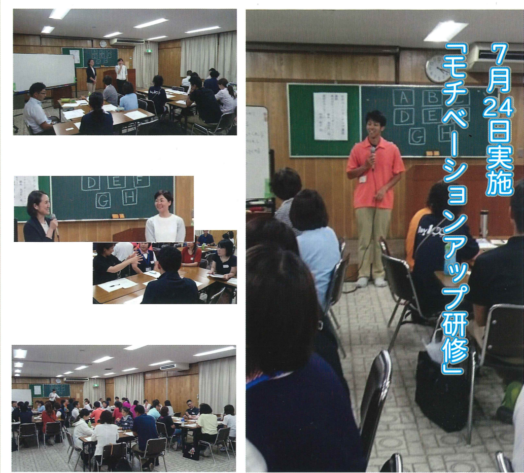
7月24日実施 「モチベーションアップ研修」