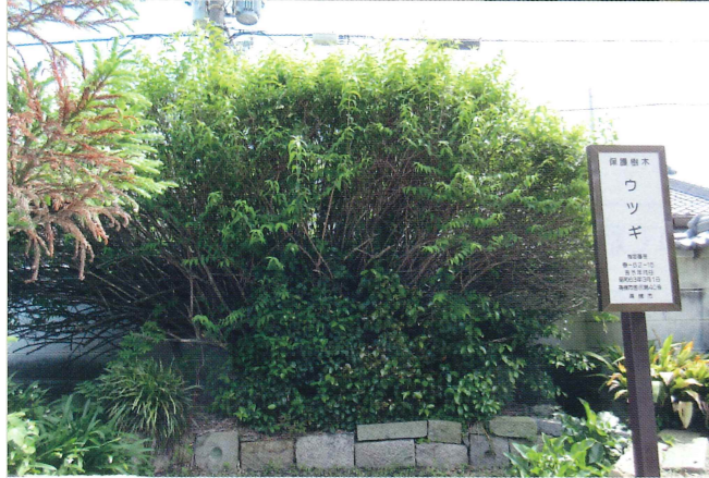
正徳寺 高槻市西面中2-16-10 西面口バス停より徒歩10分