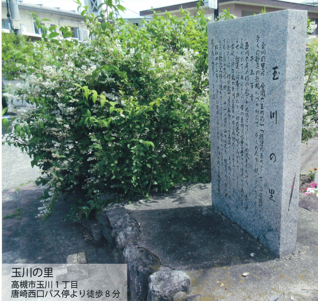
玉川の里 高槻市玉川1丁目 唐崎西口バス停より徒歩8分

本誌の誌名にもなっています「空木」とは、高槻市民の花「うの花」の別称です。この「空木」ですが、花期は5〜7月で今が丁度見頃になっていますが、本誌編集者にも高槻出身者が何名かありますが聞けば「どこに行けば空木が咲いているのか?」「空木の名所は?」と地元の方でもピンと来ないようでした(汗)。そこで本誌では、本誌ご覧の皆様のちよっとした豆知識になればと「空木」が咲いているおすすめポイント、高槻市の名所と共に不定期で紹介させていただきます。