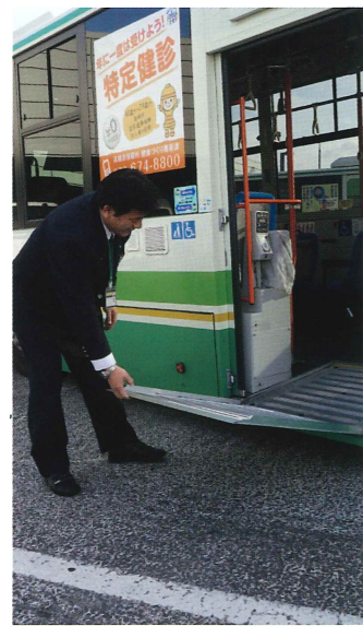
スロープを出して