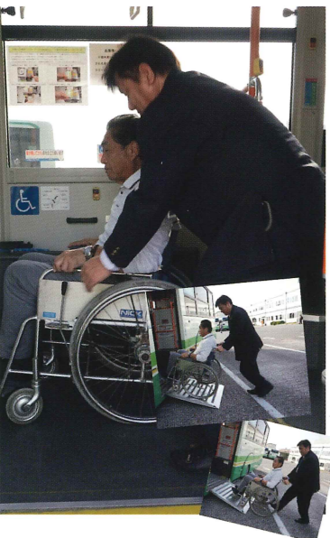
運転手さんが1人で乗降をお手伝いします

市バスの魅力を徹底解剖！ こんな身近なところにも福祉が いつも、どんな場所でも見 かける「市バス」、何気な く利用しているこの「市民 の足」とも言うべき存在で すが、実はただの「足」で はありません、市バスには 様々な福祉がたくさん詰ま ったみんなに「優しい足」 なんです。 そんな市バスを「福祉」と いう角度から徹底解剖させ ていただきました。 その他、普段聞くことが出 来ない「裏ワザ」も・・・ ぜひご覧ください！