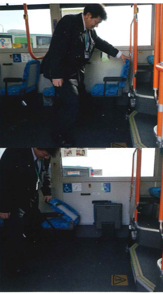
車いすマークのあるイスが折りたためます