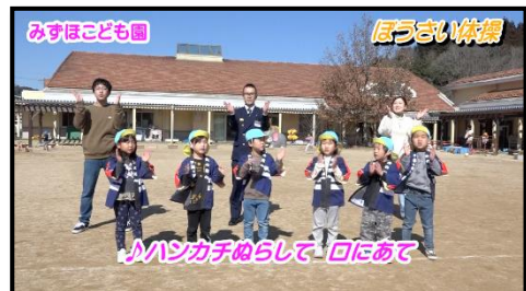
京都府京丹波町 こども園のみなさんとコラボ