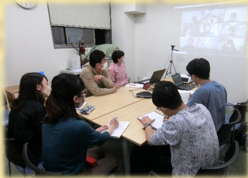
↑ 写真:防災対策部会の様子 ↑