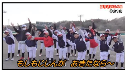
福島県西郷村 野球チームのみなさんとコラボ

「ぼうさい体操」やゼミで作成した防災教材動画はこちらからご覧いただけます(近藤ゼミの日々の活動プログラムも公開中)